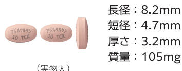
アジルサルタン錠10mg [TCK]