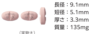
アジルサルタン錠20mg [TCK]